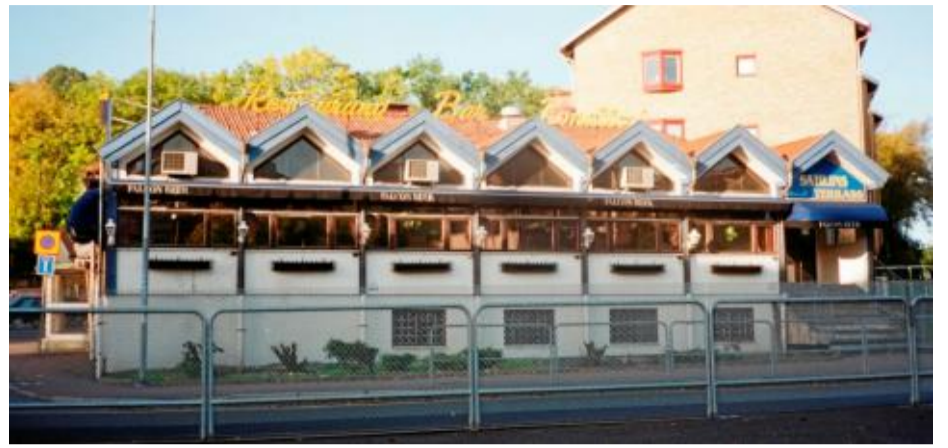
Sahlins Terrass 1996 – kunde man köpa Café au lait här?