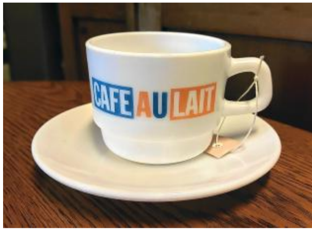
Café au lait-koppen står i Öppna magasinet på Mölndals stadsmuseum och har föremålsnummer 05141.

I mitten av 1980-talet fanns det inte en kaffekopp som var hetare än dessa två, tillverkade av duralexglas med den blå-vit-röda texten Café au lait. Tänk att få att sippa lite kaffe med mjölk ur en sådan kopp. Idag står kaffekopparna i Stadsmuseets öppna magasin men då, omkring 1985, var de svåra att få tag på och hett eftertraktade.